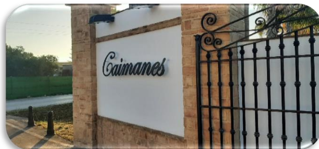
SPOT LUGAR DE CELEBRACIÓN