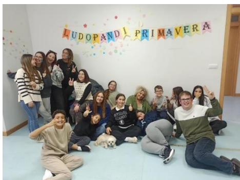
LUDOPANDI FINALIZA EL SEGUNDO TRIMESTRE