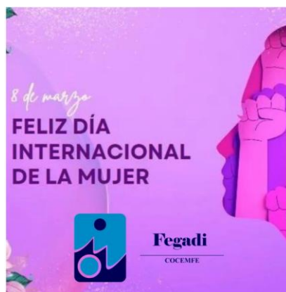
8M DÍA INTERNACIONAL DE LA MUJER EN FEGADI COCEMFE