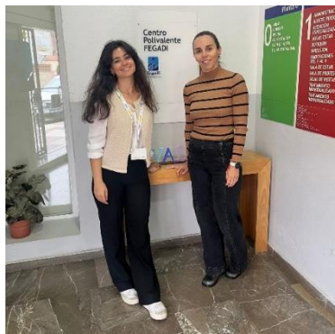
NUEVAS REUNIONES DEL ÁREA SOCIAL DE FEGADI COCEMFE