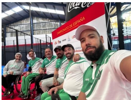
VI CAMPEONATO DE ESPAÑA DE PÁDEL EN SILLA DE RUEDAS