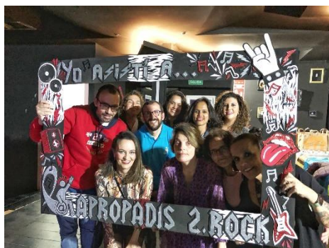
CONCIERTO SOLIDARIO A BENEFICIO DE APROPADIS 2.0