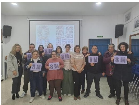
SENDOS ACTOS POR EL 8M EN APDIR