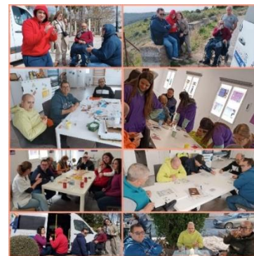
INTENSO MES DE MARZO EN PERAFÁN