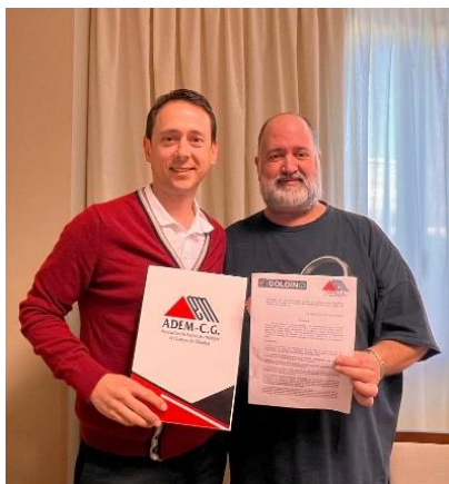
ADEM CG SIGUE SUMANDO APOYOS