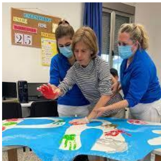
CERMI-A CONTINÚA CON SU CAMPAÑA POR UNA FINANCIACIÓN ADECUADA DE LOS CENTROS