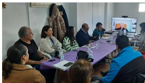
COMISIÓN COMARCAL SIERRA DE CÁDIZ