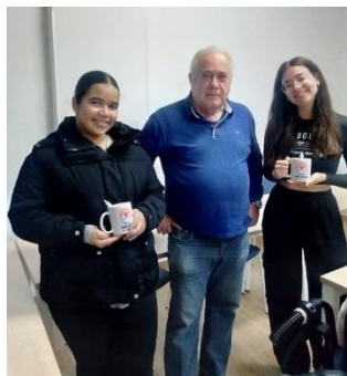
FINALIZAN LAS PRÁCTICAS EN ORION