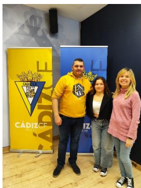
FEGADI COCEMFE EN LAS MESAS DE TRABAJO DE LA FUNDACIÓN CÁDIZ CF POR EL 8M