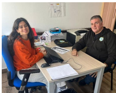
FEGADI COCEMFE SIGUE POTENCIANDO EL DEPORTE INCLUSIVO