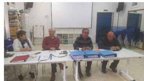
APDIR CELEBRA SU ASAMBLEA GENERAL ORDINARIA