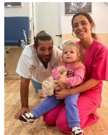
ÁGATA PROMOCIONA TERAPIAS DE REHABILITACIÓN