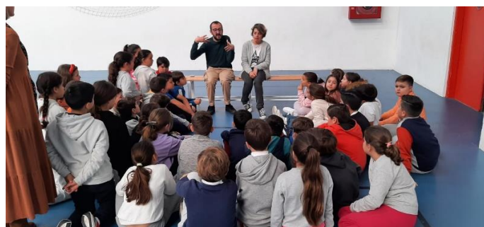
CAMPAÑA DE SENSIBILIZACIÓN EN EL CEIP MAESTRA CARIDAD RUIZ DE LA ALGAIDA (SANLÚCAR DE BDA)