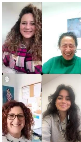
COMIENZAN LOS PREPARATIVOS DE LA IV EDICIÓN DE LA JORNADA DE LA MUJER