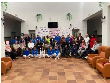
DÍA INTERNACIONAL DE LA MUJER EN LA RGA EMILIANO MANCHEÑO