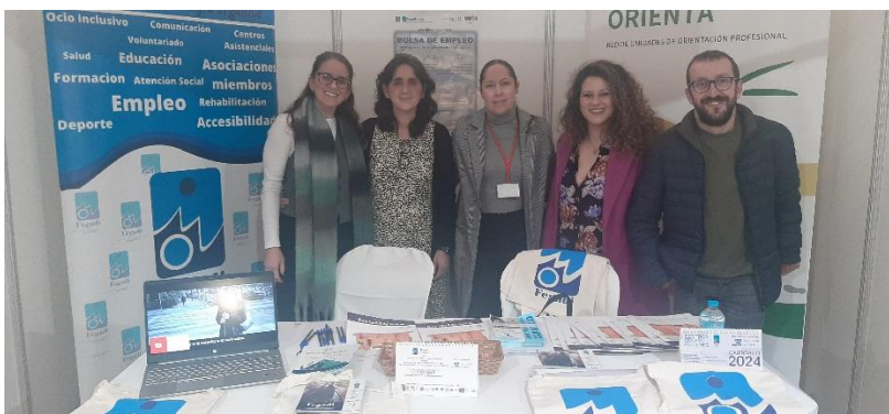
FEGADI COCEMFE EN UNA NUEVA EDICIÓN DE LA FERIA EMPLEO DE SAN ROQUE