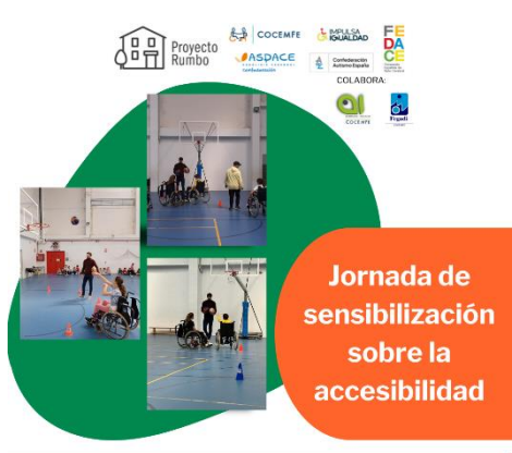
CAMPAÑA DE SENSIBILIZACIÓN A CARGO DE RUMBO