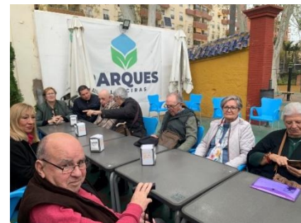
DESAYUNO CONVIVENCIA A CARGO DE PÁRKINSON SANTA ADELA