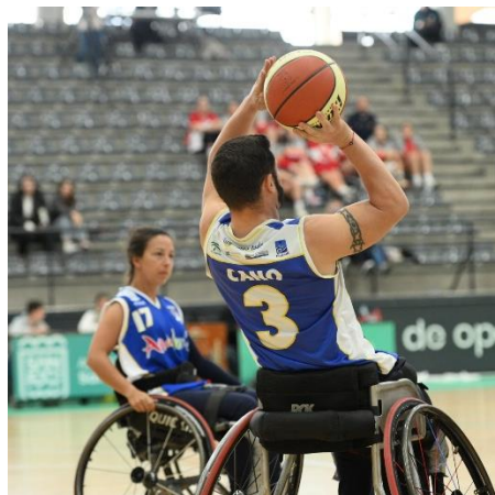
AMPLIA VICTORIA DEL CDABC FRENTE AL LEGANÉS