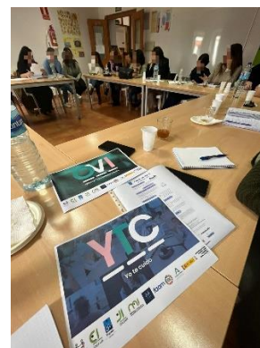
LOS PROGRAMAS YTC Y OVI EN LA REUNIÓN DEL TRIS DE LA LÍNEA