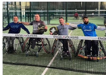
EL CDABC EN EL CAMPEONATO DE PÁDEL EN SEVILLA