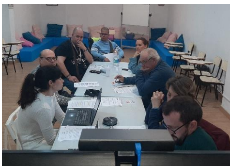
COMISIÓN COMARCAL CAMPO DE GIBRALTAR