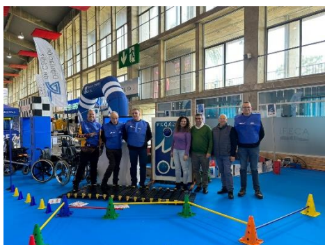
III FERIA DEL DEPORTE Y LA VIDA SANA EN IFECA