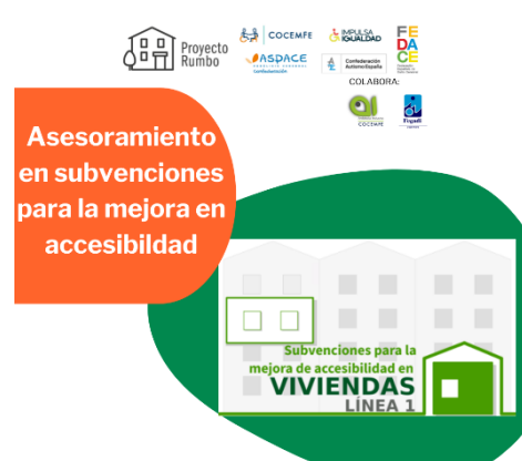
PROGRAMA DE ASESORAMIENTO DE LA MANO DE RUMBO