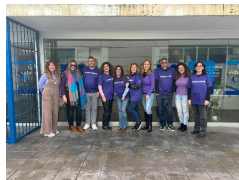
8M EN FEGADI COCEMFE