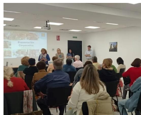
APDIR EN UNA JORNADA ORGANIZADA POR EL EXCMO. AYUNTAMIENTO DE ROTA