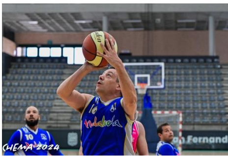
DERROTA DEL CDABC ANTE EL LÍDER