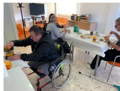
DESAYUNOS AUTÓNOMOS EN EL CENTRO POLIVALENTE