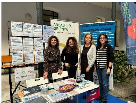
EL TOUR DEL TALENTO: UN IMPULSO A LA CREACIÓN DE EMPLEO