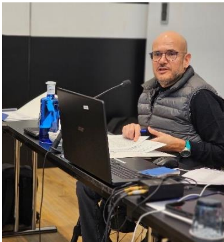
COCEMFE PIDE CELERIDAD EN LOS TRABAJOS PARA AMPLIAR LAS PATOLOGÍAS PARA JUBILACIONES ANTICIPADAS