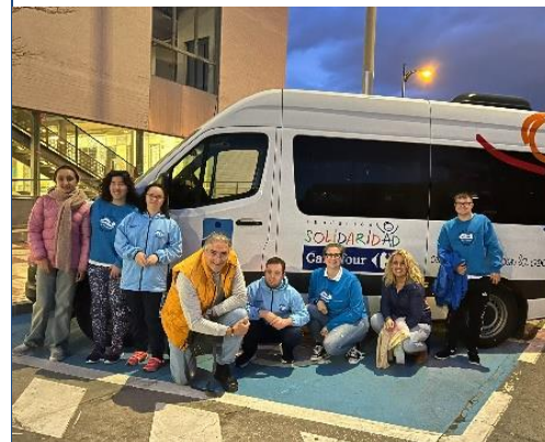
BUENA PARTICIPACIÓN DE NADAGADES EN EL CAMPEONATO DE ESPAÑA FEDDI CELEBRADO EN MÁLAGA