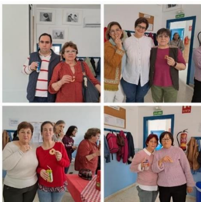
FINALIZA EL SEGUNDO TRIMESTRE EN EL TALLER DE AUTONOMÍA DE APDIR