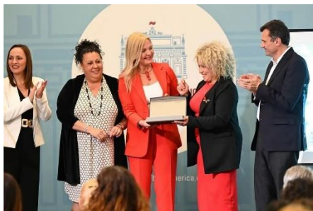
AGEBH RECOGE EL RECONOCIMIENTO A MUJERES ILUSTRES ANÓNIMAS