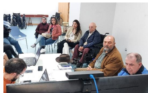
ÚLTIMA COMISIÓN COMARCAL BAHÍA DE CÁDIZ