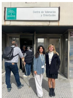
REUNIÓN CON EL EVO DE CÁDIZ