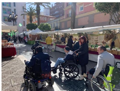
RUMBO AL MERCADO DE PRODUCTOS ANDALUCES