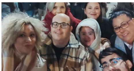
SEMANA SANTA DE CÁDIZ EN AGEBH