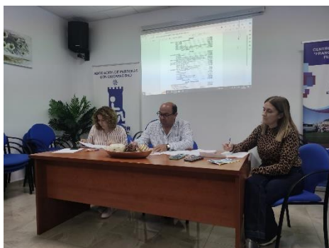
ESPÉRIDA CELEBRA SU ASAMBLEA GENERAL ORDINARIA