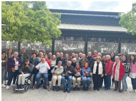
PÁRKINSON CÁDIZ EN SEMANA SANTA