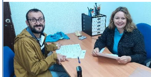
APROPADIS 2.0 Y EL CLUB DE ATLETISMO LINENSE FIRMAN SU ALIANZA POR LA INCLUSIÓN EN EL DEPORTE