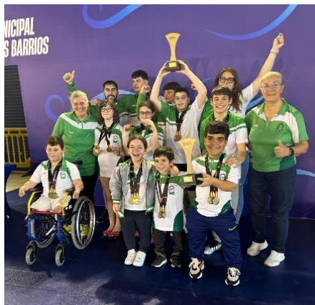
PLENO EXTRAORDINARIO EN EL CAMPEONATO DE ESPAÑA DE NATACIÓN ADAPTADA A CARGO DE NADAGADES