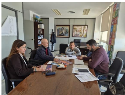
“Las Canteras pide revisar aparcamientos, playas y contenedores para garantizar la accesibilidad”