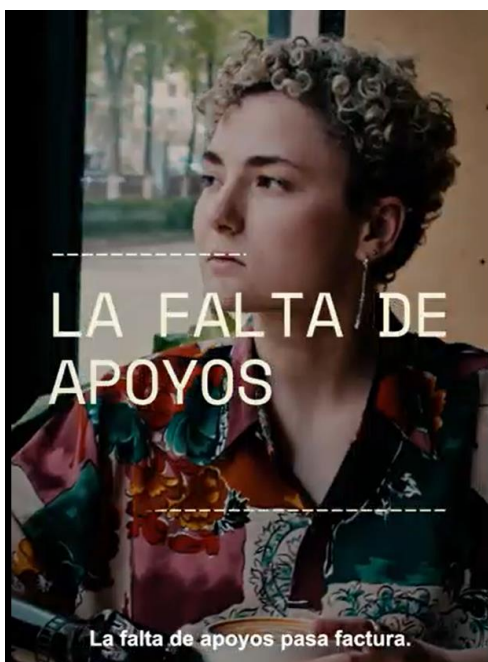
COCEMFE NACIONAL presenta las principales conclusiones de un estudio sobre malestar emocional en la discapacidad física y orgánica