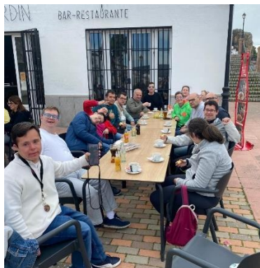
ASAMIOL impulsa el ocio inclusivo y la convivencia con una salida a Ronda, cine y merienda compartida