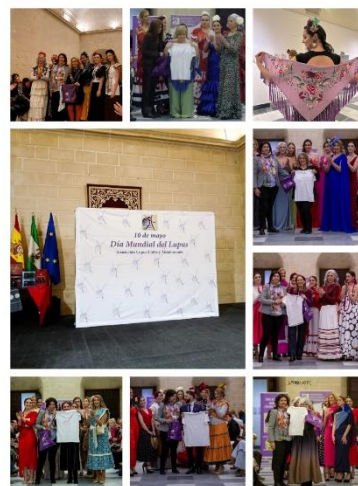
Un desfile solidario llena de inclusión y compromiso los Claustros de Santo Domingo en Jerez – Fegadi