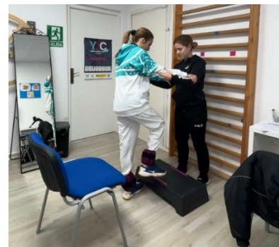
FEGADI COCEMFE impulsa la rehabilitación deportiva con el programa YoTeCuido26 en APROPADIS 2.0 – Fegadi