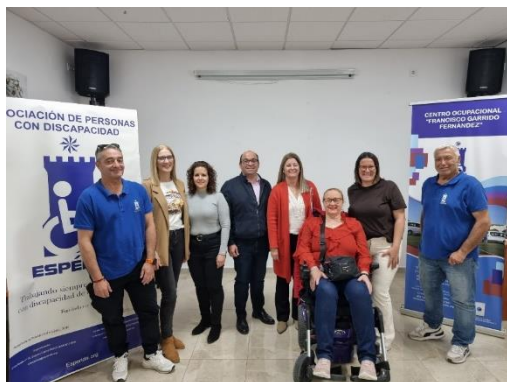
Espérida refuerza su compromiso asociativo tras la celebración de su Asamblea General Ordinaria y Extraordinaria de Elecciones