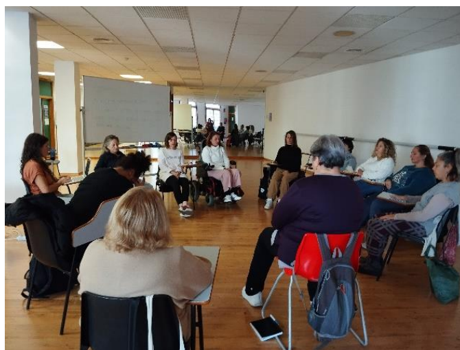
COCEMFE inicia la décima edición de su Programa de Empoderamiento y Activación para el Empleo de Mujeres con Discapacidad