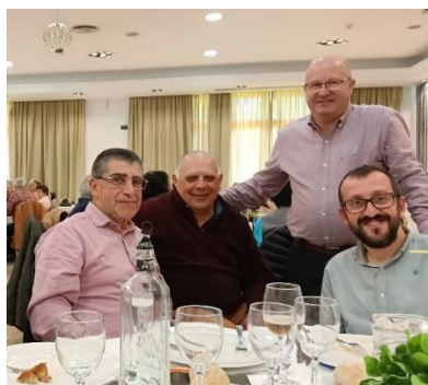
FEGADI COCEMFE acompaña a La Montera en la celebración de su 20 aniversario – Fegadi