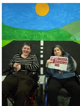
Las Aulas Inclusivas y Sostenibles de FEGADI COCEMFE ya impulsan aprendizaje y conciencia social