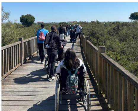
Las personas residentes de la RGA Emiliano Mancheño Ibáñez disfrutan de una jornada de convivencia en Los Toruños – Fegadi