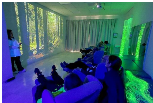
Parkinson Bahía de Cádiz estrena su nueva sala multisensorial