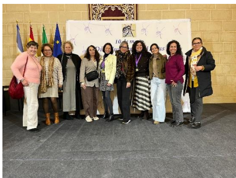
La solidaridad y la moda se unen en Jerez para dar visibilidad al Lupus – Fegadi