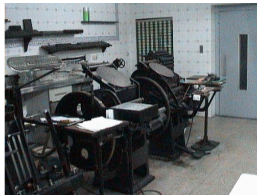
La Asociación Comarcal De Minusválidos Del Campo De Gibraltar (A.C.M.A.), Agradece La Colaboración De La A.P.B.A.