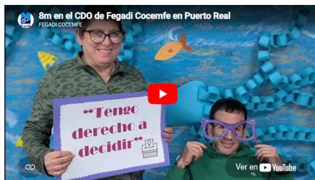
8M en el CDO de Fegadi Cocemfe en Puerto Real – Fegadi