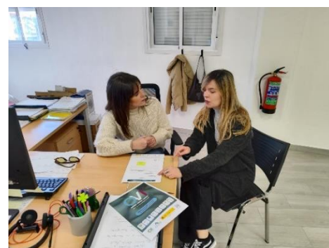
FEGADI COCEMFE refuerza alianzas con agentes sociales para impulsar la inclusión a través de ERACIS+ y la OVI – Fegadi