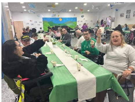
CELEBRAMOS EL DÍA DE ANDALUCÍA EN EL CENTRO POLIVALENTE DE FEGADI COCEMFE – Fegadi