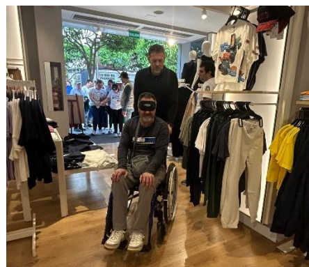
DISCUBRIQ acerca la moda accesible a la ciudadanía en la Semana de la ONCE en Andalucía