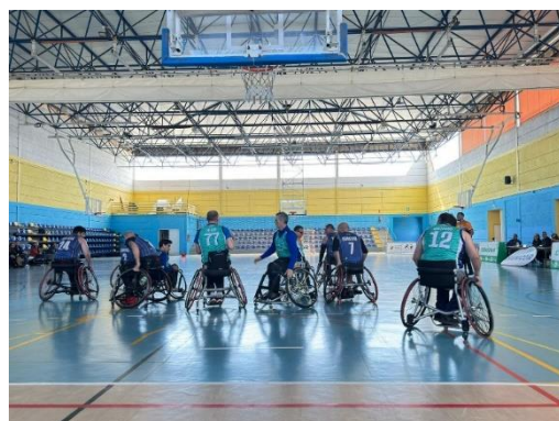
El Club Deporte Adaptado Bahía de Cádiz cae en la visita al Covirán Churriana Inclusivo