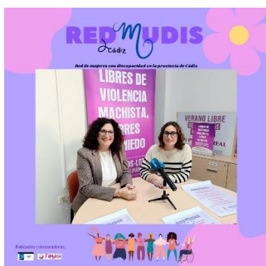
REDMUDISCÁDIZ y el Ayuntamiento de Puerto Real presentan una nueva actividad para impulsar la participación de mujeres con discapacidad –