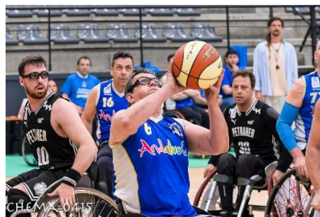
El CDABC vence por la mínima ante el Club Melilla Baloncesto Ciudad del Deporte en la octava jornada del grupo B de la Segunda División nacional de baloncesto en silla de ruedas