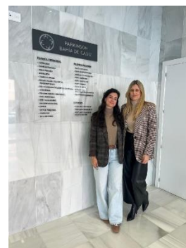
FEGADI COCEMFE visita el nuevo centro de Parkinson Bahía de Cádiz en San Fernando – Fegadi