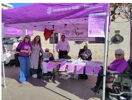
La asistencia personal de la OVI impulsa la participación de AGADI en las actividades del 8M – Fegadi