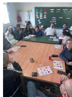
ASAMIOL refuerza el bienestar emocional y las habilidades sociales a través de su taller grupal de Educación Emocional – Fegadi