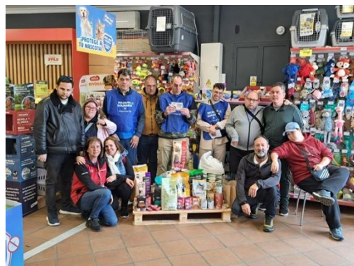
“El programa de Ocio Inclusivo de Las Canteras colabora en una recogida solidaria para animales”