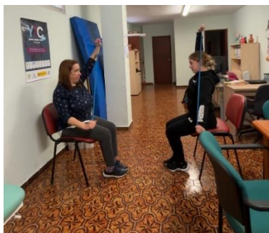
FEGADI COCEMFE promueve la rehabilitación deportiva con ejercicios de resistencia en AEBH CG de Algeciras – Fegadi