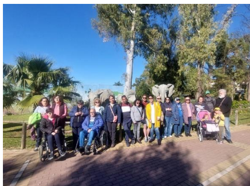
AFEDE LLENA UN MES DE MARZO DE ACTIVIDADES INCLUSIVAS.