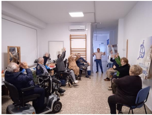
EL PROGRAMA MI VIDA MI RUMBO FOMENTA EL BIENESTAR DE LAS PERSONAS CON DISCAPACIDAD DE LA SIERRA DE CÁDIZ