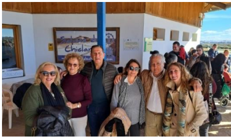
SALIDA A LA SALINA SANTA MARÍA JESÚS A CARGO DE ACCU CÁDIZ