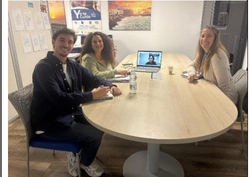
REUNIÓN DE COORDINACIÓN DEL PROGRAMA CÁDIZ EN MOVIMIENTO