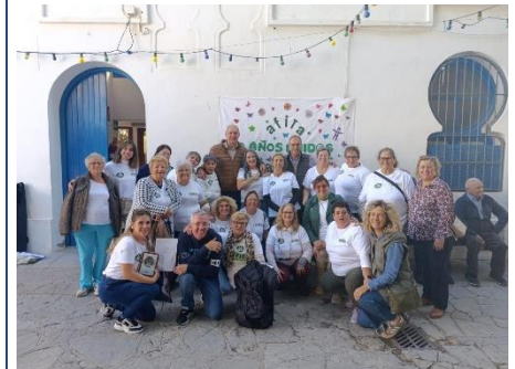
AFITA CELEBRA SU 20 ANIVERSARIO