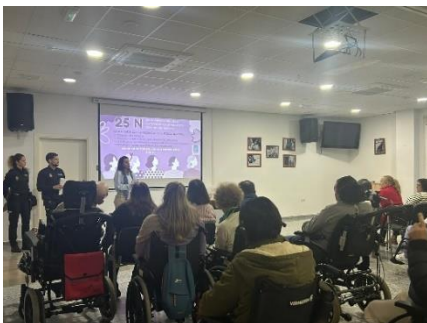
JORNADA DE SENSIBILIZACIÓN POR EL 25N CON LA PARTICIPACIÓN DE LA POLICÍA NACIONAL