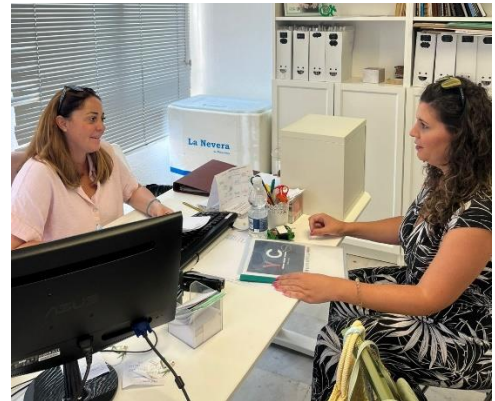
YTC RED LLEGA A LA ENTIDAD ÁGATA