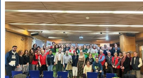
DISCUBRIO PROSIGUE SU LABRO COMPROMETIDA CON LA DISCAPACIDAD