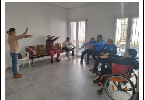
BORNOS SE SUMA A LA MUSICOTERAPIA GRACIA AL PROGRAMA MI VIDA MI RUMBO