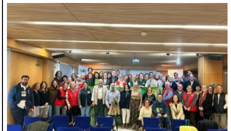
ACCU CÁDIZ PARTICIPA EN LA REUNIÓN PROVINCIAL DEL VOLUNTARIADO