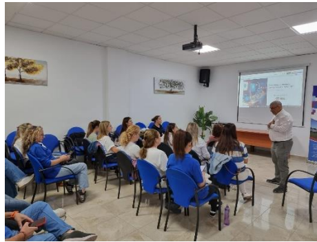
FEGADI IMPARTE UN TALLER SOBRE INTELIGENCIA ARTIFICIAL EN SU ENTIDAD MIEMBRO ESPÉRIDA