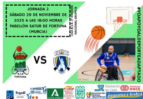
EL CDABC CAE ESTREPITOSAMENTE EN TIERRAS MURCIANAS