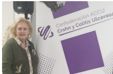
III EDICION DEL CONCURSO ARTEII A CARGO DE ACCU CÁDIZ