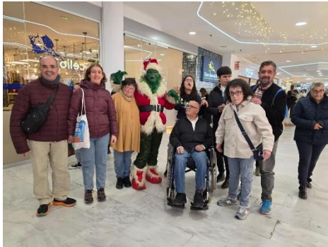
AFEDE CELEBRA UN MES REPLETO DE ACTOS Y ACTIVIDADES PARA LOS MÁS JÓVENES