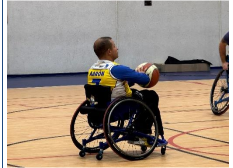
MAGNÍFICA TERCERA PLAZA OBTENIDA POR EL CDABC EN LA COPA ANDALUCÍA