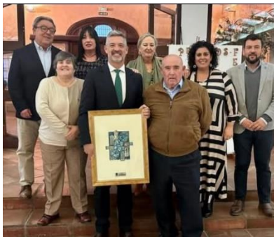
APDIR CONTINÚA SU INGENTE LABOR EN NOVIEMBRE