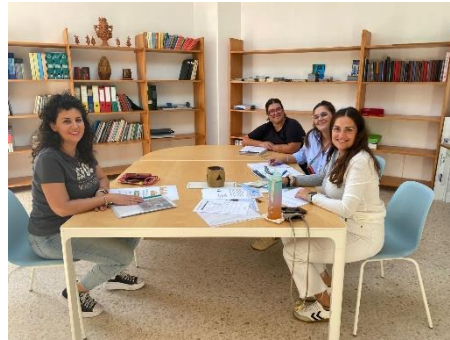
REUNIÓN DEL PROGRAMA YOTECUIDO RED CON LA COORDINADORA DESPIERTA