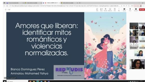
TALLER “AMORES QUE LIBERAN” DESARROLLADO POR REDMUDIS POR EL 25N