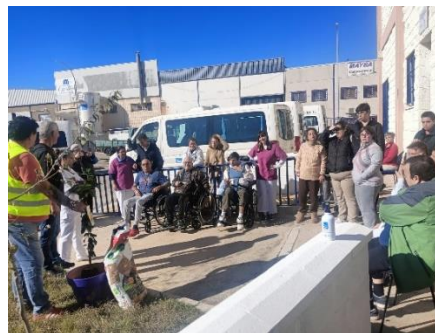
EL CDO DE PUERTO REAL REALIZA PLANTA UN LIMONERO EN HONOR AL 25N