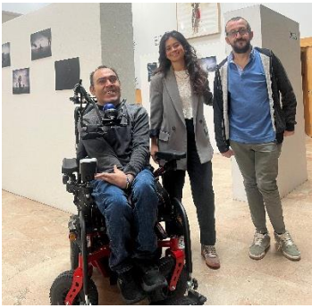
FEGADI PARTICIPA EN LA MESA DE LA DISCAPACIDAD DEL EXCMO. AYUNTAMIENTO DE ALGECIRAS