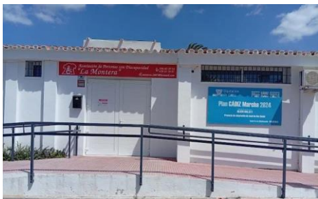
LA MONTERA SE EQUIPA GRACIAS A LA DIPUTACIÓN DE CÁDIZ