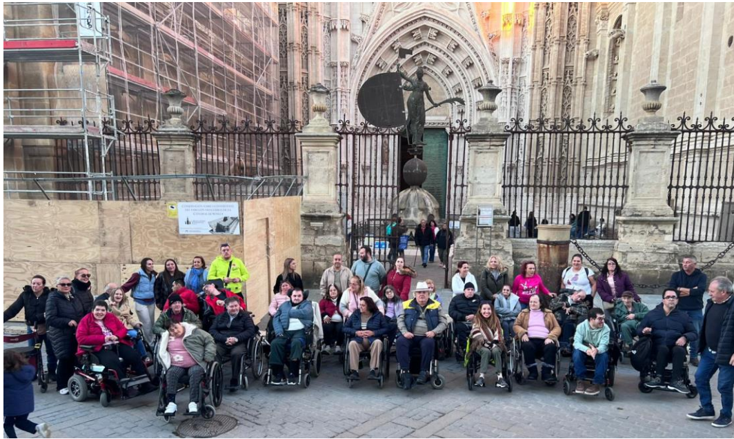
UN DÍA INOLVIDABLE POR SEVILLA A CARGO DEL CENTRO POLIVALENTE