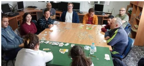
ASAMIOL FOMENTA LA AUTONOMÍA PERSONAL