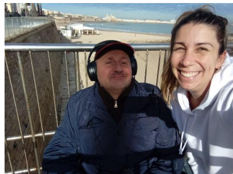
PROGRAMA CÁDIZ EN MOVIMIENTO FOMENTANDO LA VIDA DIARIA