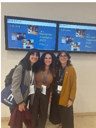
EL PROGRAMA INCORPORA EN UNA JORNADA DE TRABAJO