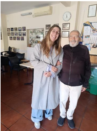
PROGRAMA CÁDIZ EN MOVIMIENTO: ACOMPAÑAMIENTO Y OCIO INCLUSIVO