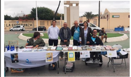
FEGADI ACOMPAÑA A SU ENTIDAD MIEMBRO APROPADIS EN EL MERCADILLO DE LA LÍNEA DE LA CONCEPCIÓN.