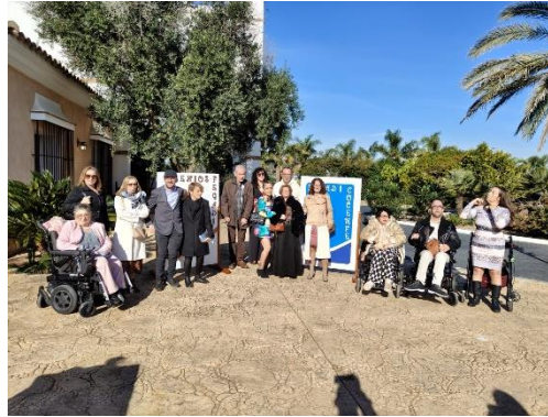
APROPADIS 2.0 CULMINA UN MES DE ACTIVIDAD EDUCATIVAS, DEPORTIVAS Y COMUNITARIAS