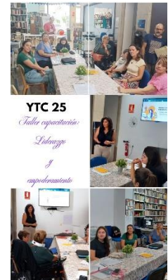
TALLER SOBRE LIDERAZGO A CARGO DEL PROGRAMA YOTECUIDO RED