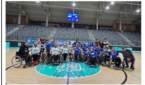
EL CDABC SE ESTRENA CON UNA ABULTADA VICTORIA