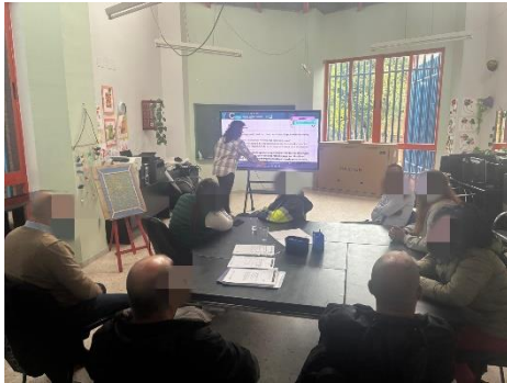
FEGADI IMPARTE UN TALLER EN LA COORDINADORA DESPIERTA GRACIAS AL PROGRAMA YOTECUIDO RED