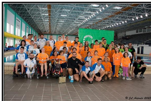
NADAGADES CAMPEONA DE ANDALUCÍA DE NATACIÓN ADAPTADA