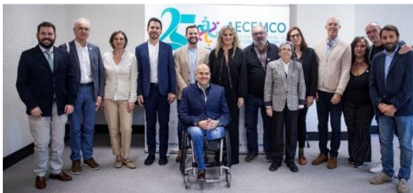
AECEMCO CELEBRA SU 25 ANIVERSARIO