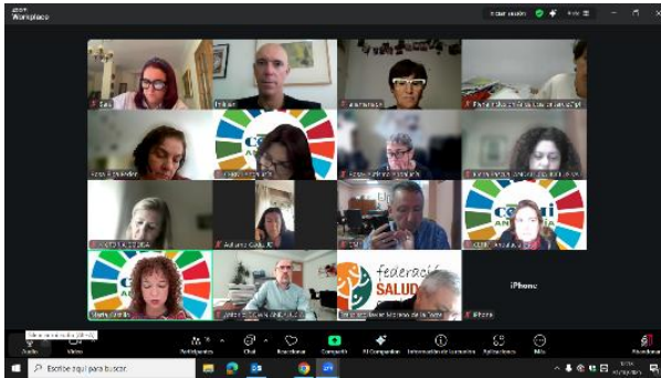
COMITÉ EJECUTIVO DEL CERMI-A