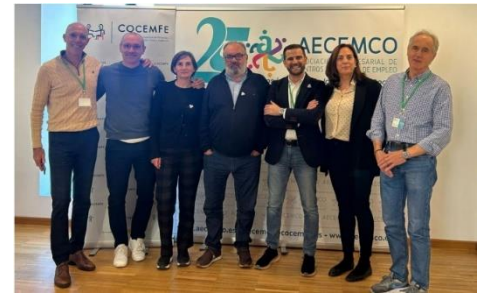
COCEMFE ORGANIZA UNA CUMBRE SOBRE LOS CEEIS