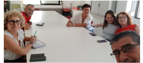
FEGADI COCEMFE IMPARTE UN TALLER DE COMUNICACIÓN EN AFEDE