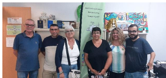
FEGADI COCEMFE SIGUE POTENCIAR LA COMUNICACIÓN CON SUS ENTIDADES MIEMBROS