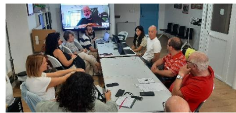
FEGADI CIERRA SU RONDA DE COMARCALES EN EL CAMPO DE GIBRALTAR