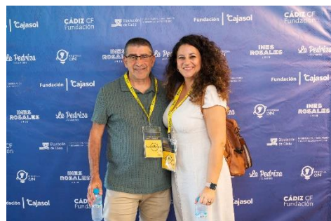
FEGADI COCEMFE PARTICIPA EN LAS II JORNADAS INNOVA DE LA FUNDACIÓN CÁDIZ CF