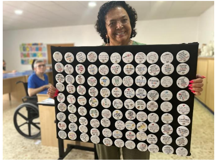
EL CENTRO POLIVALENTE LANZA SU INICIATIVA "CHAPAS SOLIDARIAS"