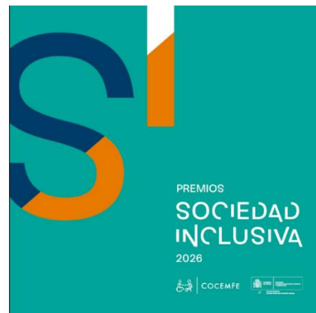
COCEMFE CONVOCA LOS PREMIOS SOCIEDAD INCLUSIVA