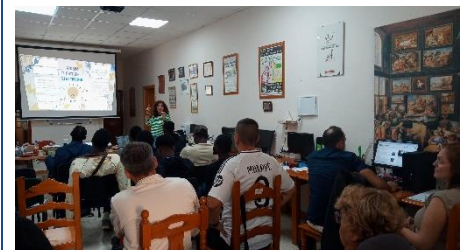
ECONOMÍA DOMÉSTICA EN LAS CANTERAS