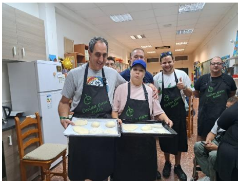
TALLER DE PAN CASERO EN LAS CANTERAS