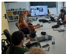
SEGUNDA COMISIÓN COMARCAL CON LAS ENTIDADES DE LA BAHÍA DE CÁDIZ