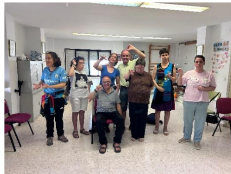
TALLERES Y CREATIVIDAD EN AFEDE