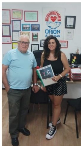
YTC RED SE PRESENTA EN LA ENTIDAD ORION ALGECIRAS