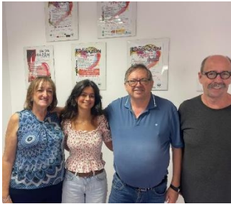
FEGADI COCEMFE AVANZA EN LA INCORPORACIÓN DE ENTIDADES