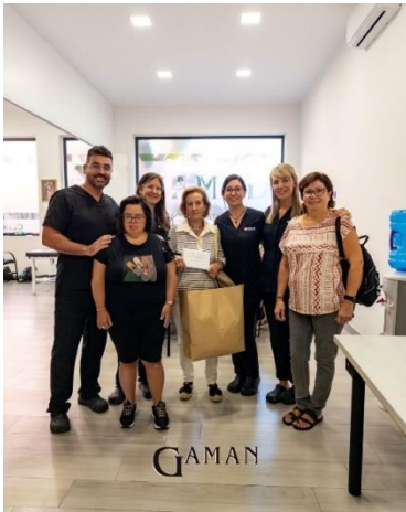
APDIR RECIBE UNA DONACIÓN DE LA CLÍNICA GAMAN