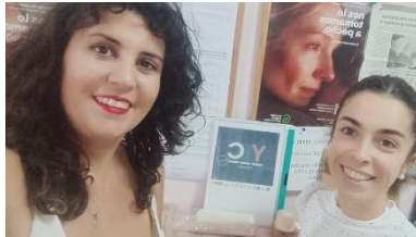
YTC RED SE REÚNE CON LA ASOCIACIÓN CONTRA EL CÁNCER EN ALGECIRAS