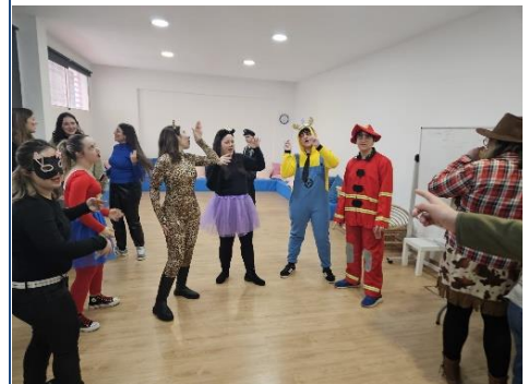
ORION CELEBRA LA FIESTA DE HALLOWEEN