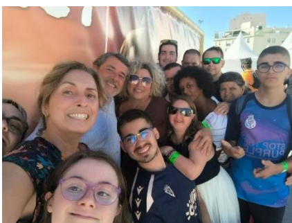
AGEBH CELEBRA UN MES DE OCTUBRE LLENO DE