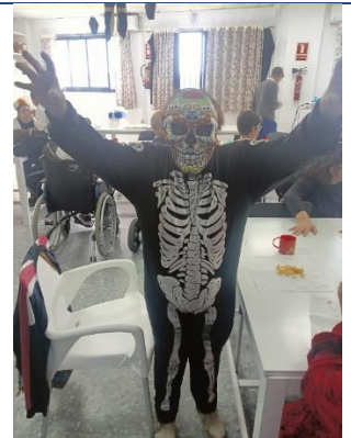
CDO PUERTO REAL