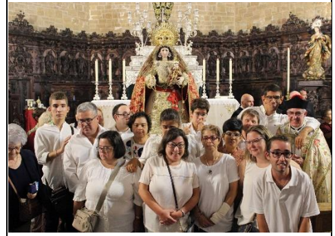
APDIR EN LOS ACTOS EN TORNO AL DÍA DE LA PATRONA