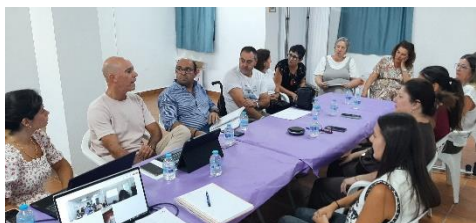
ARRANCAN LAS COMISIONES COMARCALES EN LA SIERRA DE CÁDIZ