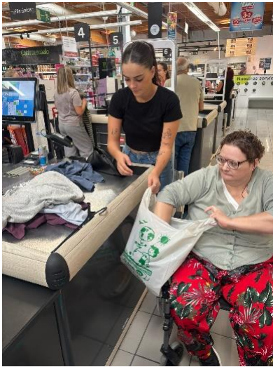
LA RGA EMILIANO MANCHEÑO FOMENTA LA VIDA EN COMUNIDAD