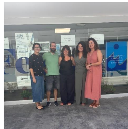
ARRANCA EL NUEVO CURSO DE LOS EQUIPOS DE ORIENTACIÓN LABORAL EN FEGADI COCEMFE