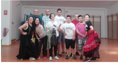
ASAMIOL ARRANCA EL CURSO CON UN ENCUENTRO DE PLANIFICACIÓN CON SOCIOS Y FAMILIARES