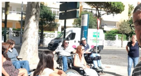
FEGADI COCEMFE EN EL CIRCUITO INACCESIBLE ORGANIZADO POR AGADI EN CÁDIZ