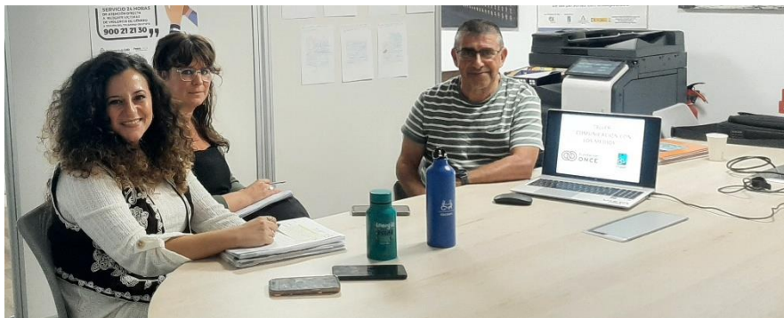
NUEVO TALLER SOBRE COMUNICACIÓN CON LOS MEDIOS