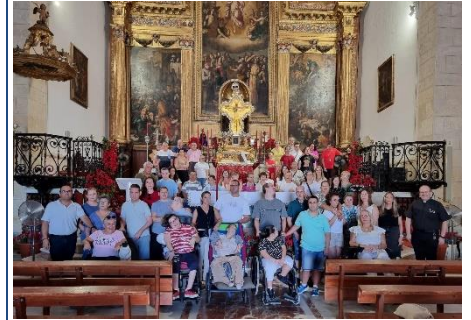
ESPÉRIDA VISITA AL SANTO PATRÓN