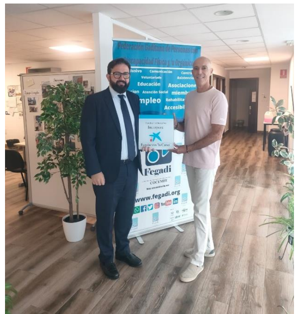
CAIXA BANK PERMITE LA REPARACIÓN DE LAS INSTALACIONES DE FEGADI COCEMFE