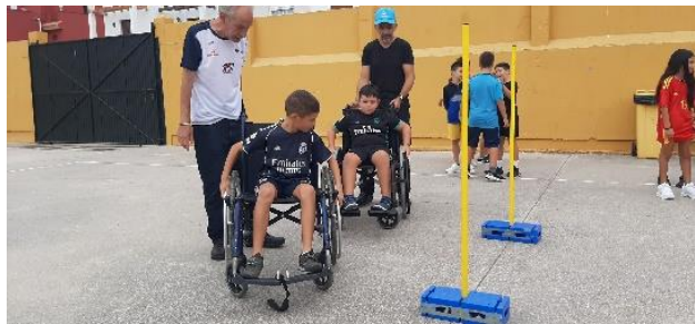
FEGADI EN EL CEIP PEDRO SIMÓN ABRIL DE LA LÍNEA