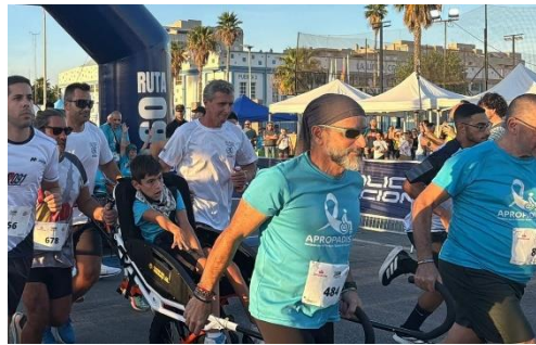
APROPADIS 20.: UN MES LLENO DE PARTICIPACIÓN E INCLUSIÓN