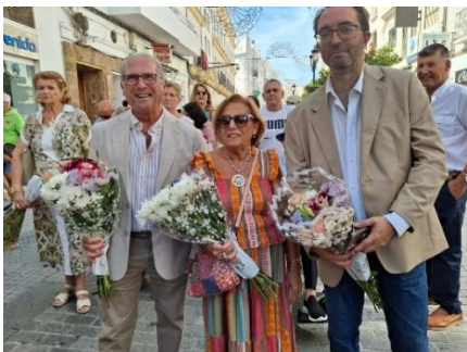
PARKINSON BAHÍA DE CÁDIZ EN LA OFRENDA FLORAL DE LA PATRONA DE CHICLANA