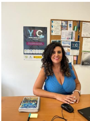
ARRANCA EL PROGRAMA YO TE CUIDO RED EN EL CAMPO DE GIBRALTAR