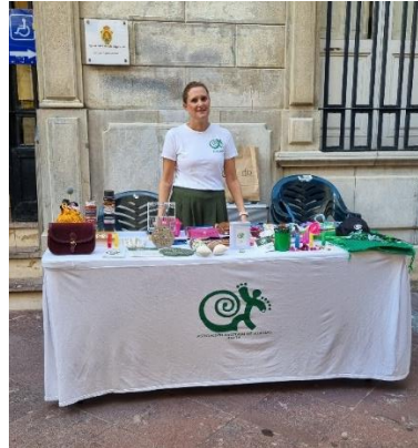
AGATA VISIBILIZA LA ATAXIA EN ALGECIRAS EN SU DÍA MUNDIAL