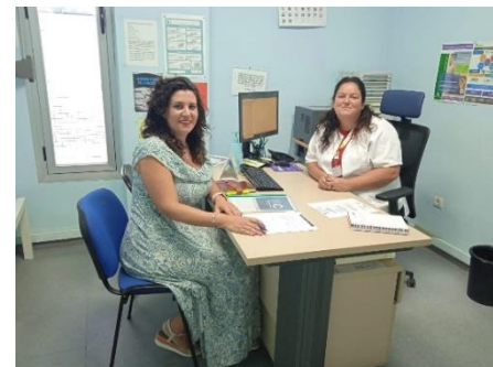
REUNIÓN CON EL CENTRO DE SALUD DE PONIENTE DE LA LÍNEA DE LA CONCEPCIÓN.