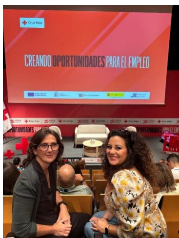
VI FERIA DE EMPLEO DE LA CRUZ ROJA EN CÁDIZ: CREANDO OPORTUNIDADES PARA EL EMPLEO