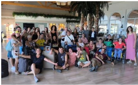
AGEBH CELEBRA SU TRADICIONAL CAMPAMENTO DE VERANO