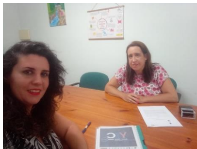
FEGADI COCEMFE IMPULSA EL PROGRAMA YO TE CUIDO RED EN SUS ENTIDADES DEL CAMPO DE GIBRALTAR