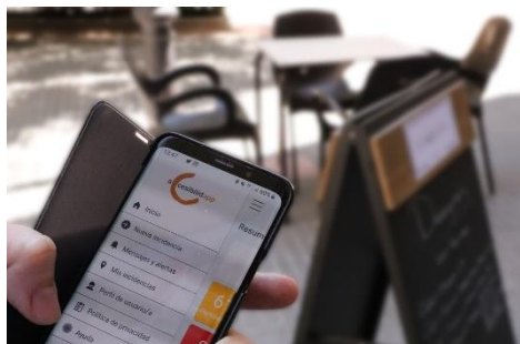
FEGADI Y SU MOVIMIENTO ASOCIATIVO REIVINDICAN UNA ACCESIBILIDAD UNIVERSAL