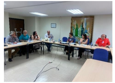
APODI TRASLADA AL MINISTERIO LA HOJA DE RUTA DE SU MOVIMIENTO ASOCIATIVO