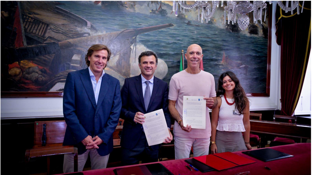
IMPORTANTE FIRMA DE CONVENIO CON EL AYUNTAMIENTO DE CÁDIZ PARA FAVORECER UNA INCLUSIÓN REAL DEL COLECTIVO DE PERSONAS CON DISCAPACIDAD FÍSICA Y ORGÁNICA