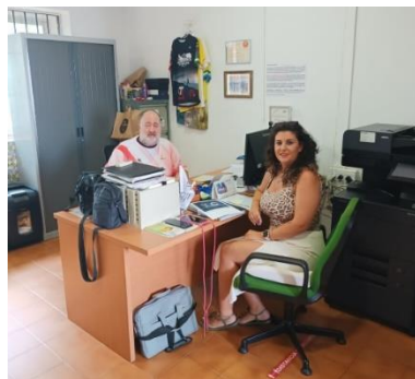
YO TE CUIDO RED EN CANAL SUR RADIO CAMPO DE GIBRALTAR