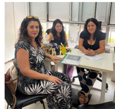
FINALIZA LA RONDA DE CONTACTOS DEL PROGRAMA YO TE CUIDO RED CON LAS ENTIDADES MIEMBROS