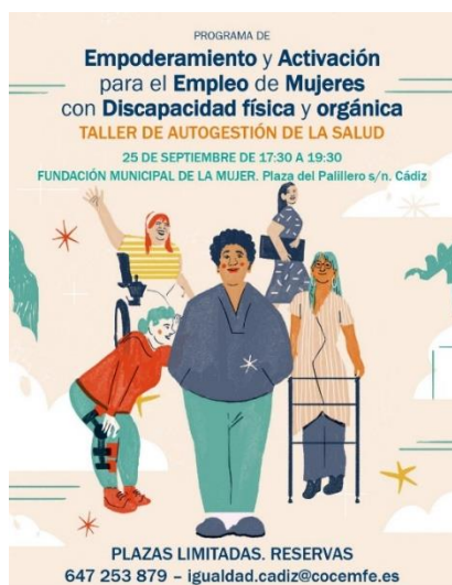
COMIENZAN TALLERES DE EMPODERAMIENTO EN CÁDIZ