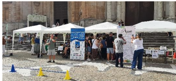
FEGADI EN LA PLAZA CATEDRAL DE CÁDIZ